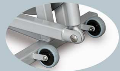
Ruedas de desplazamiento y 4 niveladores para posicionamiento horizontal del andador.

Dimensiones y características: Largo, ancho, alto: 120 x 50 x 170 cm.; Peso total: 78 Kg. Volante inercia: 22 Kg.; Transmisión por cadena 128 eslabones, plato 46 Z, piñón 16 Z, relación de pedaleo 1:2.875; Estructura: Chasis de acero de alta resistencia St-52, sobredimensionado y soldado, con tratamiento anticorrosión y pintura epoxi con secado a 220°.