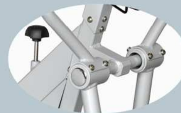
14 rodamientos de primera calidad, sobredimensionados, libres de mantenimiento