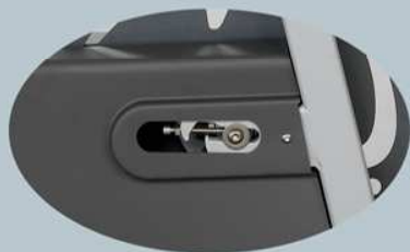
Fácil acceso al tensor de cadena

Pueden equiparse opcionalmente con monitor electrónico.